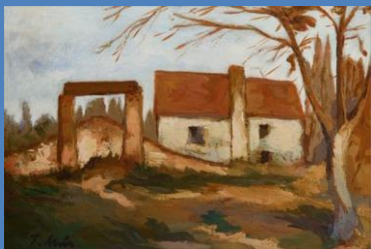
Paisaje. Joaquín Mir

En cuanto al género paisajístico cobran relevancia, una obra firmada por el prestigioso pintor Joaquín Torres García, así como las obras del Museo de Madrid: Jardín , del artista catalán Santiago Rusiñol o un paisaje del máximo exponente del postimpresionismo catalán, Joaquín Mir.