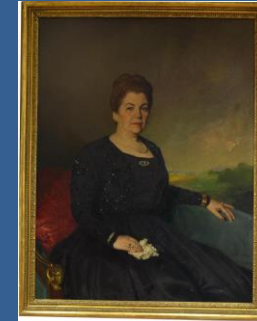
Retrato de Señora, 1948 Manuel Benedito Vives

Bronces y esculturas criselefantinas (combinación de dos materiales: marfil y bronce), pertenecientes a Art Nouveau y Art Decó, están representadas por obras de prestigiosos artistas franceses de finales del siglo XIX hasta mediados del siglo XX que conforman los fondos del Museo Félix Cañada de Madrid, verán por primera vez la luz, al lado de otros que se exhiben habitualmente. Citando nombres de la talla como Dimitri Chiparus o Claire Jeanne Colinet, una de las primeras mujeres escultoras Art Decó.