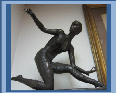
Bailarinas, Dimitri Chiparus